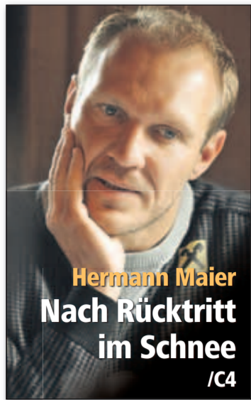
Hermann Maier Nach Rücktritt im Schnee /C4