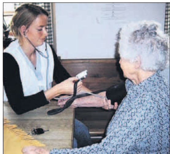
Auch Blutdruckmessungen werden am Gesundheitstag angeboten.