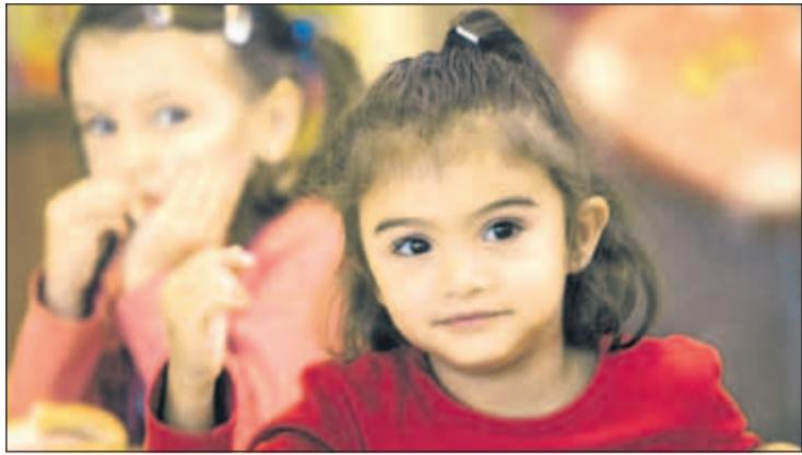
Kindergärten: Betreuungsquote der vier- und fünfjährigen Kinder liegt bei 96 Prozent, Elternbeiträge variieren aber landesweit.

■ RH-Prüfbericht: Elternbeiträge für Kindergärten landesweit unterschiedlich.